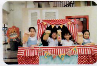
DIY Hand Puppet