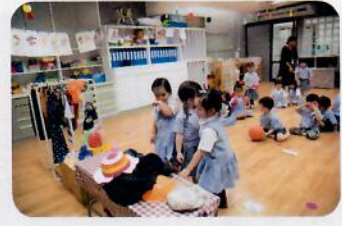
Pack and go