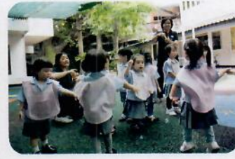
Bubble & Music